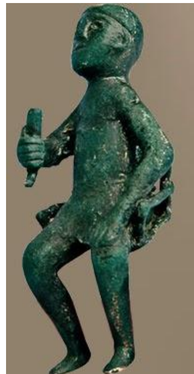
Tamada- Capotavola (VII sec. a.C)