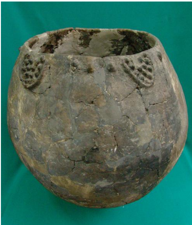
Kvevri- Giarra di Terracotta (V-VI millennio)

Natura splendida, monumenti paleocristiani, vino e noti piatti tradizionali georgiani, uniti all'ospitalità georgiana, farà sentire ogni visitatore il benvenuto!